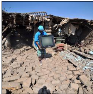
ภาพความเสียหายบางส่วนที่เกิดจากเหตุการณ์แผ่นดินไหว