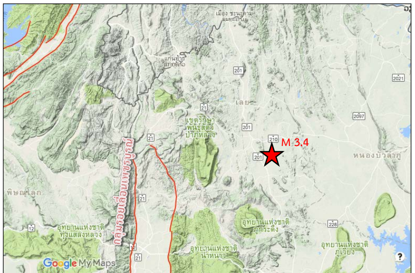
แผนที่ตำแหน่งจุดเหนือศูนย์เกิดแผ่นดินไหว ขนาด 3.4 บริเวณอำเภอวังสะพุง จังหวัดเลย