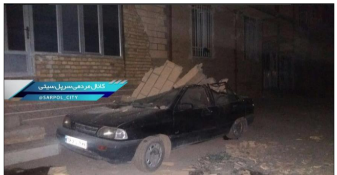
ภาพความเสียหายที่เกิดจากแผ่นดินไหวขนาด 6.0