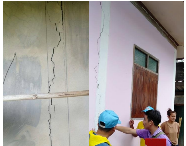
ภาพความเสียหายบ้านน้ำซ้าง ม.11 ต.ขุนน่าน อ.เฉลิมพระเกียรติ จ.น่าน