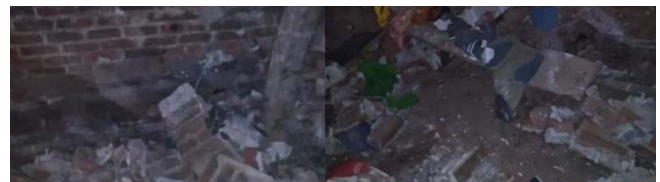
ภาพความเสียหาย