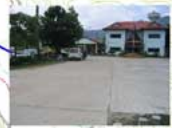
โรงแรมก๊กพาบานนทีควน พื้นที่ใช้ประโยชน์ 6,100 ตารางเมตร