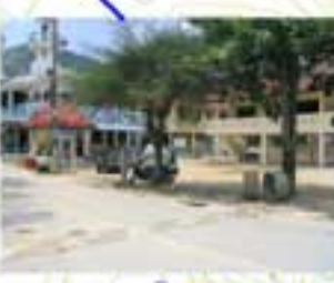
โรงแรมก๊กพาบานนทีควน พื้นที่ใช้ประโยชน์ 1,000 ตารางเมตร

417000 419000 421000 423000 425000 427000 429000