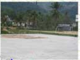
โรงแรมก๊กพาบานนทีควน พื้นที่ใช้ประโยชน์ 4,000 ตารางเมตร