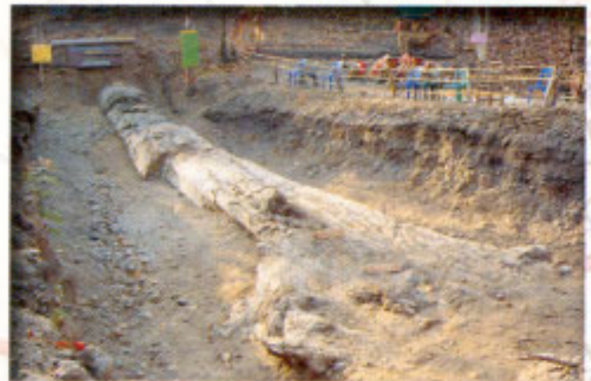
ไม้กลายเป็นหิน

นอกจากนี้ ยังพบเศษไม้กลายเป็นหินขนาดต่าง ๆ กระจายอยู่ในท้องห้วย และตามที่ลาดเชิงเขาอีกมาก