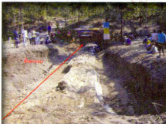
หลุมขุดไม้กลายเป็นหินความยาว ประมาณ 20 เมตร (วันที่ 22 ธันวาคม 2546)