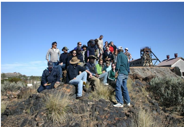
รูปที่ 3 บริเวณแหล่งแร่ตะกั่ว-สังกะสี ที่ Broken Hill ประเทศออสเตรเลีย (รูปถ่าย ปี ค.ศ 2006)