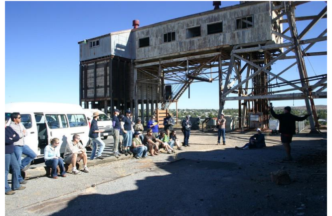
รูปที่ 2 เหมือง Junction (Ag-Pb-Zn) เป็นเหมืองเก่าในตำนาน เริ่มผลิตแร่ตั้งแต่ปี ค.ศ. 1886 และได้ปิดตัวลงแล้ว (รูปถ่าย ปี ค.ศ 2006)