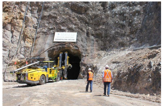
รูปที่ 6 บริเวณเหมืองแร่ตะกั่ว-สังกะสี ที่ Broken Hill ประเทศออสเตรเลีย ที่ยังคงดำเนินการอยู่ โดยบริษัท Perilya