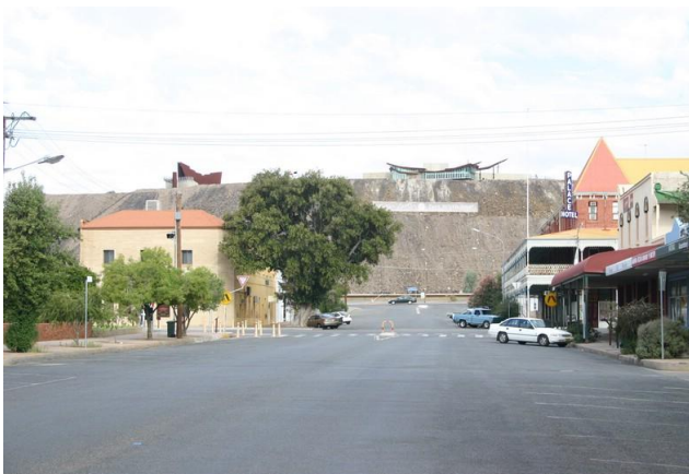
รูปที่ 5 บริเวณเหมืองแร่ตะกั่ว-สังกะสี ที่ Broken Hill ประเทศออสเตรเลีย เริ่มทำเหมืองตั้งแต่ปี ค.ศ. 1884 และยังคงดำเนินการอยู่ (รูปถ่าย ปี ค.ศ 2006)