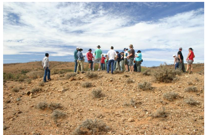
รูปที่ 4 ลักษณะภูมิประเทศของบริเวณแหล่งแร่ตะกั่ว-สังกะสี Broken Hill ประเทศออสเตรเลีย (รูปถ่าย ปี ค.ศ 2006)