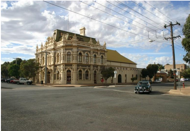
รูปที่ 1 เมือง Broken Hill รัฐนิวเซาท์เวลส์ ประเทศออสเตรเลีย เป็นเมืองขึ้นมาเพราะมีแหล่งแร่ตะกั่ว-สังกะสี (Mining town) (รูปถ่าย ปี ค.ศ 2006)