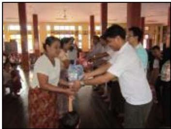
ช่วยเหลือผู้ประสบภัยน้ำท่วม