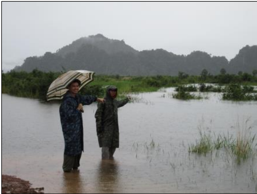
ตะลุยฝนเข้าไปในพื้นที่หินปูน