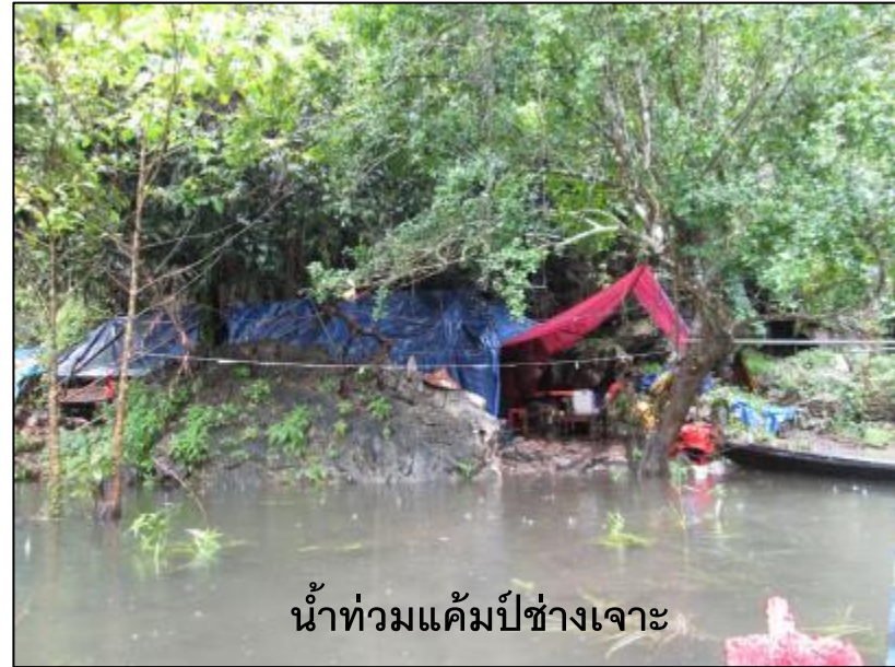
น้ำท่วมแคมป์ข้างเขา