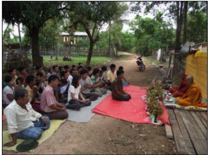
ทำบุญกับชาวบ้าน