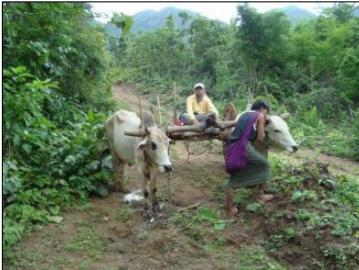
พาหนะเขົ่า Site