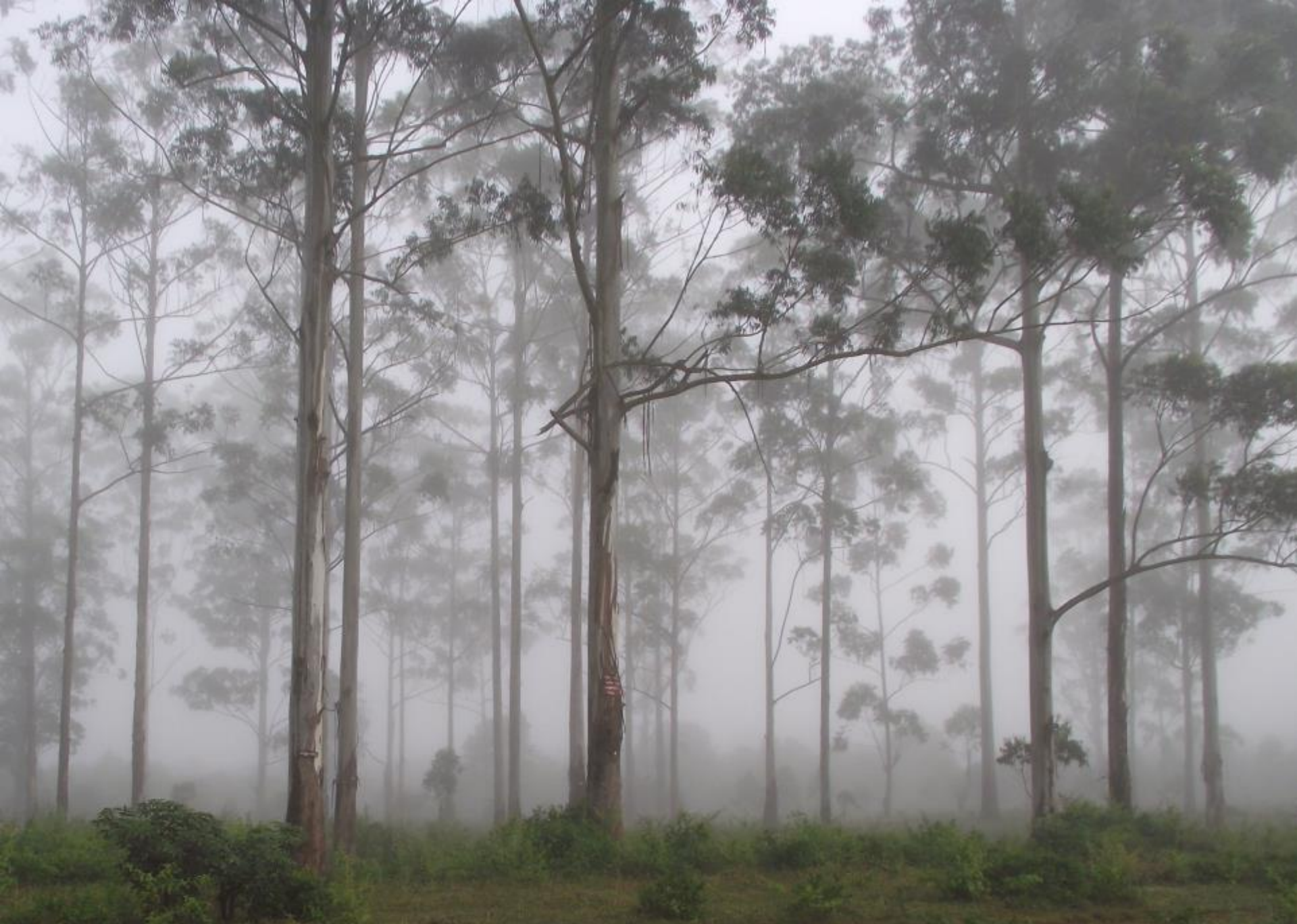
บรรยากาศสองข้างทางไป Heho ในหน้าหนาว