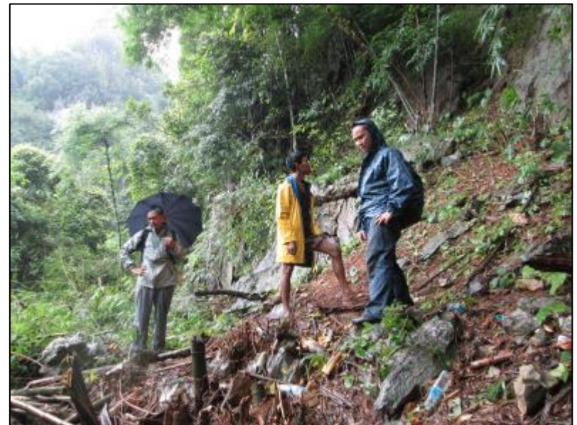
ตรวจสอบสภาพพื้นที่หลุมเขา