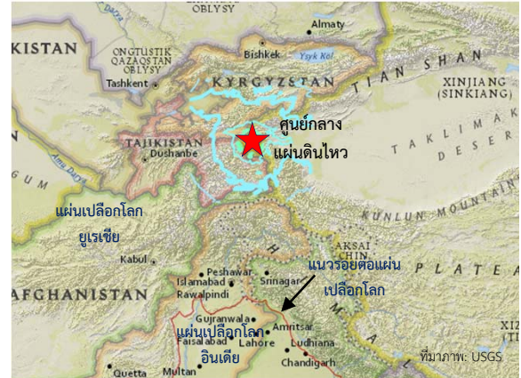
แผนที่แสดงตำแหน่งศูนย์กลางแผ่นดินไหว

เกิดแผ่นดินไหวขนาด 6.6 (USGS) ระดับความลึก 12.6 กม. บริเวณแนวเทือกเขา ทิมาลัย ในสาธารณรัฐประชาชนจีน ใกล้พรมแดนระหว่างสาธารณรัฐ ประชาชนจีน ใกล้กับประเทศคีร์กีซสถานและพรมแดนทาจิกิสถาน ห่างจากเมืองคัชการ์ไปทางตะวันตก ประมาณ 170 กม. ทั้งนี้มีรายงาน การเกิดแผ่นดินไหวตาม (Aftershocks) จำนวน 2 ครั้ง ขนาดตั้งแต่ 4.6 – 4.8 (ข้อมูล ณ วันที่ 26 พ.ย.59 เวลา 18.41 น.)