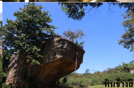
หินช้างสี