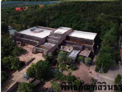
พิพิธภัณฑ์สิรินธร