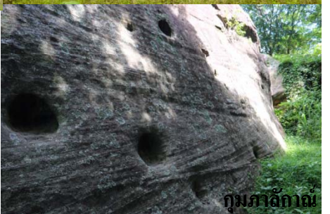
ภูมภักดิ์