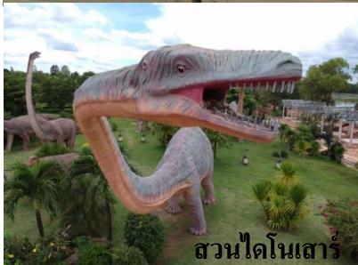
สวนไดโนเสาร์