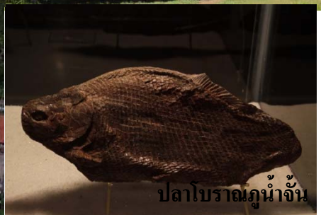
ปลาโบราณภูน้ำจั้น