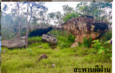
สะพานผีผ่าน