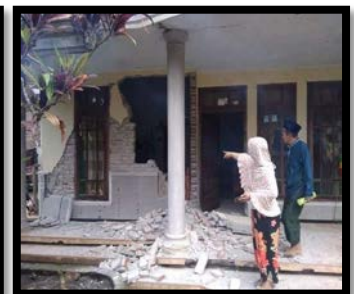
ภาพแสดงความเสียหายของบ้านเรือน