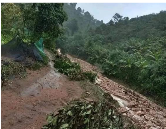
ภาพก้อนหินที่ถูกน้ำป่าพัดพาลงมา