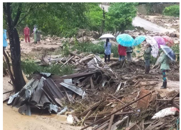
ภาพความเสียหายจากน้ำป่าไหลหลาก