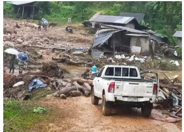
ชาวบ้านและทหาร SSA กำลังค้นหาผู้สูญหายและเสียชีวิต

จากเหตุการณ์ในครั้งนี้ เบื้องต้นมีบ้านเรือนได้รับความเสียหายจำนวน 6 หลังคาเรือน มีผู้สูญหายจำนวน 2 คน และพบผู้เสียชีวิตอย่างน้อย 6 ราย เป็นชาย 2 ราย หญิง 4 ราย ล่าสุดทางชาวบ้านและทหาร SSA ยังต้องเข้ากุ๊ซากปรักหักพังและตามหาผู้ที่คาดว่าจะสูญหายอีก 2 คน ต่อไป (ที่มา : ผู้จัดการออนไลน์ และแนวหน้า)