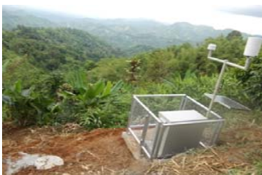
การติดตั้งเครื่องวัดการเคลื่อนตัวของมวลดิน