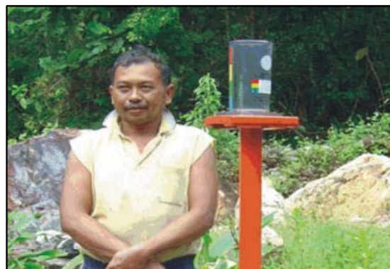
อาสาสมัครเครือข่าย วัดปริมาณน้ำฝน