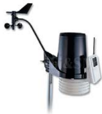
ระบบบันทึกและส่งข้อมูล GPRS/DATA