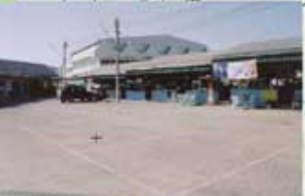
ตลาดแม่อูบล พื้นที่โดยประมาณ 1,000 ตารางเมตร