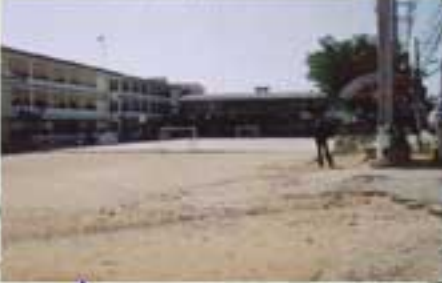
โรงเรียนสุวรรณคีรีวงศ์ พื้นที่โดยประมาณ 7,000 ตารางเมตร