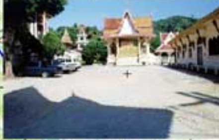
วัดสุวรรณคีรีวงศ์ พื้นที่โดยประมาณ 10,000 ตารางเมตร