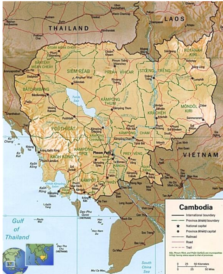
รูปที่ 1 แผนที่ภูมิประเทศแสดงตำแหน่งที่ตั้งของประเทศกัมพูชา