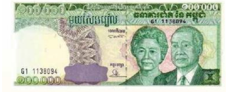
รูปที่ 3 แสดงตัวอย่างธนบัตรของประเทศกัมพูชา

สกุลเงินที่ใช้ในกัมพูชา คือ ใช้สกุลเงิน - เรียล โดยมีอัตราแลกเปลี่ยนค่อนข้างเสถียรภาพ ประมาณ 4,000 เรียล ต่อ 1 ดอลลาร์สหรัฐ หรือประมาณ 100 เรียล ต่อ 1 บาท