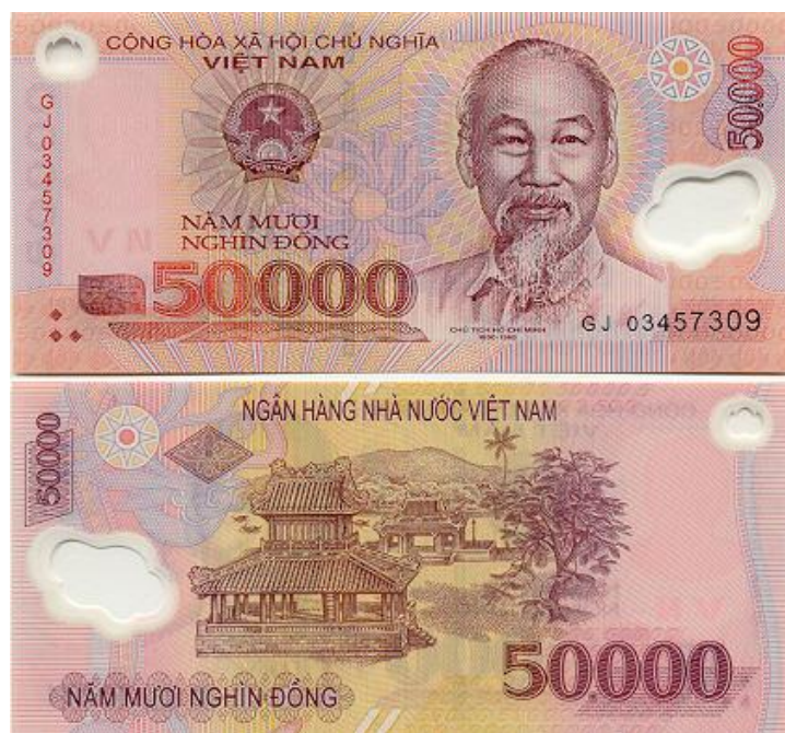
รูปที่ 3 แสดงตัวอย่างธนบัตรสกุลเงินดองของประเทศเวียดนาม

สกุลเงินของเวียดนาม คือ ดอง (Dong : VND) อัตราแลกเปลี่ยนอยู่ที่ 21,095.13 ดอง = US$ 1 และอัตราและเปลี่ยนกับเงินบาทอยู่ที่ 674.27 ดอง = 1 บาท ( ณ วันที่ 16 สิงหาคม 2556)