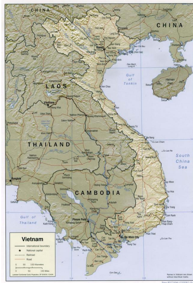
รูปที่ 1 แผนที่ภูมิประเทศแสดงตำแหน่งที่ตั้งของประเทศเวียดนาม