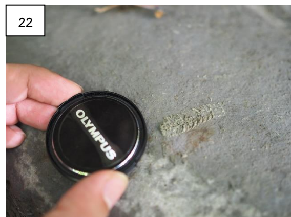
รูปที่ 19-22 ฝึกปฏิบัติการภาคสนาม การเก็บข้อมูลเบื้องต้นและวิธีสังเกตซากดึกดำบรรพ์ ณ แหล่งซากดึกดำบรรพ์นอตลอยต์เขาพนมเขียด อำเภอร่อนพิบูลย์ จังหวัดนครศรีธรรมราช