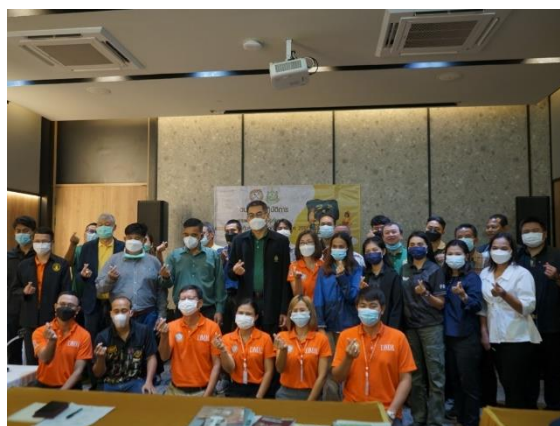
รูปที่ 4 ประธานในพิธี ผู้เข้าร่วมโครงการ และคณะเจ้าหน้าที่ผู้จัดการอบรม ถ่ายภาพหมู่ร่วมกัน