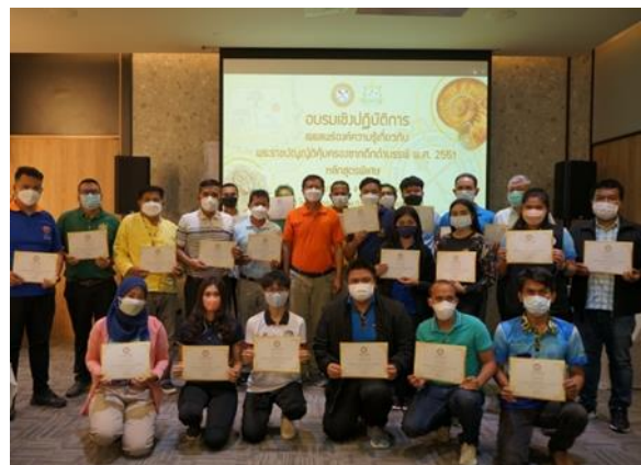
รูปที่ 31-32 พิธีปิดการอบรม และถ่ายภาพหมู่ร่วมกัน