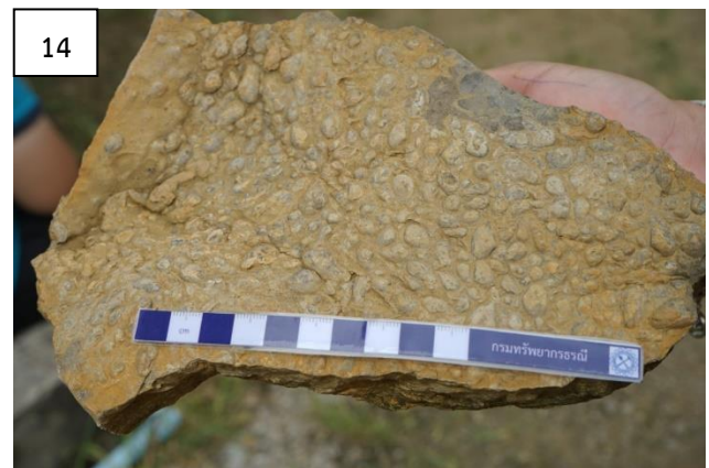
รูปที่ 11-14 ฝึกปฏิบัติภาคสนาม การเก็บข้อมูลเบื้องต้นและวิธีสังเกตซากดึกดำบรรพ์ ณ แหล่งซากดึกดำบรรพ์หอยสองฝามาบซิง อำเภอบางขัน จังหวัดนครศรีธรรมราช

2. แหล่งซากดึกดำบรรพ์บ้านวังหอน อำเภอลำดวน จังหวัดนครศรีธรรมราช (รูปที่ 15-18) พิกัด UTM : 587066 E 872640 N ลักษณะภูมิประเทศเป็นเนินเขาเล็ก ๆ ต่อเนื่องไปถึงหน้าผาหินปูน เป็นแหล่งซากดึกดำบรรพ์แกรบโตไลต์ ลักษณะปรากฏเป็นรอยขีดสีขาว (แกรไฟต์) ในหินดินดาน หินทรายแป้ง สีดำ ชั้นบางถึงปานกลาง เกิดในยุคไซลูเรียน - ดีโวเนียน ตามแผนที่ธรณีวิทยา มาตราส่วน 1:50,000 ระวาง 4924 | อำเภอลำดวน