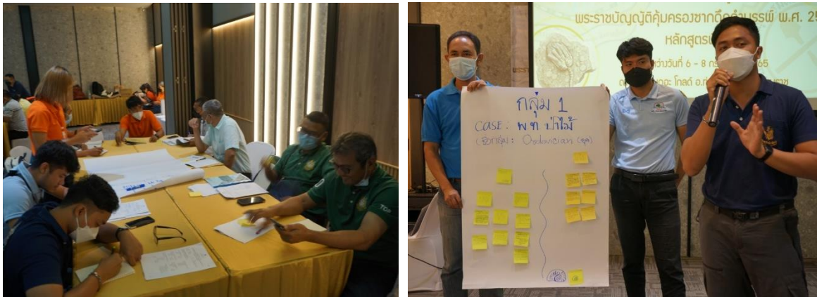
รูปที่ 23-24 การระดมความคิดเห็น และการนำเสนอของกลุ่มที่ 1 (พื้นที่ป่าไม้-อุทยานแห่งชาติ)

แจ้งเจ้าหน้าที่องค์การปกครองส่วนท้องถิ่นทราบ เพื่อประชาสัมพันธ์ให้ประชาชนทราบถึงความสำคัญของซากดึกดำบรรพ์ ไม่ให้ผู้นั่งผู้ใดเข้าไปแสวงหาผลประโยชน์