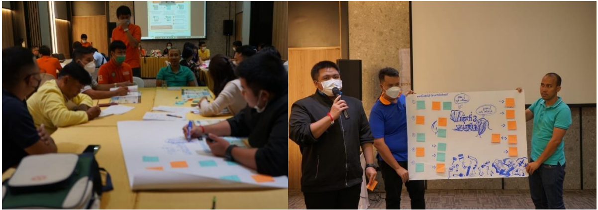
รูปที่ 27-28 การระดมความคิดเห็น และการนำเสนอของกลุ่มที่ 3 (พื้นที่เอกชน)