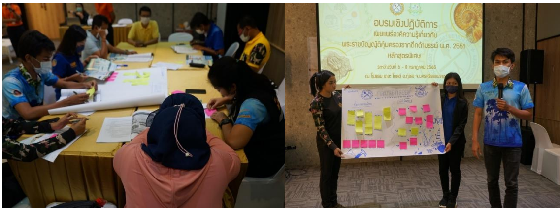
รูปที่ 25-26 การระดมความคิดเห็น และการนำเสนอของกลุ่มที่ 2 (พื้นที่ราชการ)