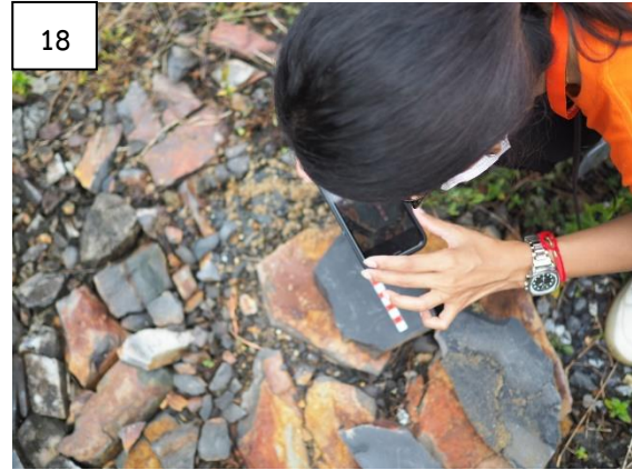
รูปที่ 15-18 ฝึกปฏิบัติการภาคสนาม การเก็บข้อมูลเบื้องต้นและวิธีสังเกตซากดึกดำบรรพ์ ณ แหล่งซากดึกดำบรรพ์ แกรบไต่ไลต์บ้านวังหอน อำเภอชะอวด จังหวัดนครศรีธรรมราช

3. แหล่งซากดึกดำบรรพ์เขาพนมเขียด อำเภอร่อนพิบูลย์ จังหวัดนครศรีธรรมราช (รูปที่ 19-22) พิกัด UTM : 593240 E 902346 N ลักษณะภูมิประเทศเป็นหน้าผาหินปูน มีร่องรอยการทำเหมือง พบซากดึกดำบรรพ์นอตลอยต์ในหินปูนเนื้อดิน สีเทา จัดอยู่ในหมวดหินรังนก กลุ่มหินทุ่งสง ยุคออร์โดวิเซียน ตามแผนที่ธรณีวิทยา มาตรฐาน 1:50,000 ระวัง 4925 II อำเภอร่อนพิบูลย์