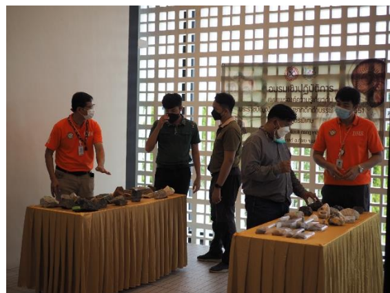
รูปที่ 10 แสดงตัวอย่างหิน แร่