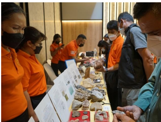
รูปที่ 9 แสดงตัวอย่างซากดึกดำบรรพ์