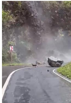
ภาพความเสียหายที่เกิดจากแผ่นดินไหว