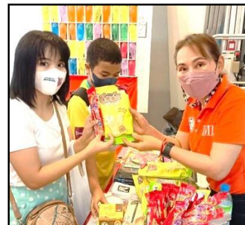
กิจกรรมปาโป่งมหาสนุก