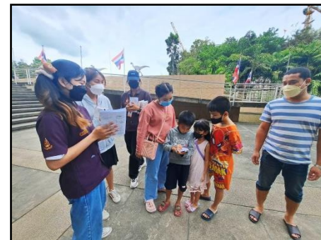
กิจกรรม Nature Walk & Family Trail