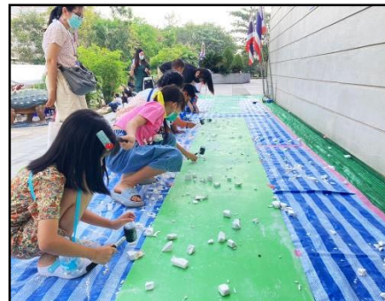
กิจกรรมซูดซาดักดำบรรพ์