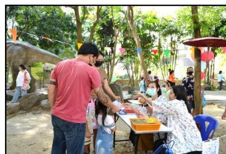
กิจกรรม Rock Paniting และพิพิธภัณฑ์สัญจร โดย พิพิธภัณฑสถานแห่งชาติกาญจนาภิเษก