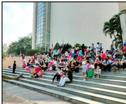
ภาพรวมบรรยากาศภายในงาน