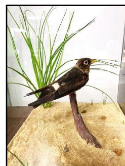
นิทรรศการสัตว์สต๊าฟฟ์ โดย องค์การสวนสัตว์แห่งประเทศไทย