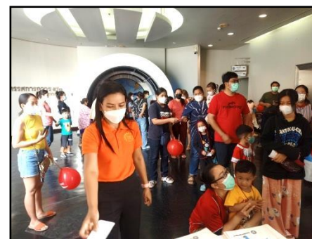
กิจกรรมวงล้อहरษา