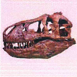
ซากดึกดำบรรพ์