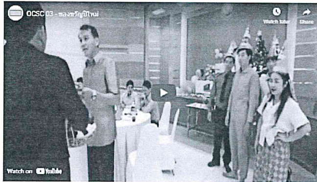
งานวิจัยธรรมปิโตรเลียม องค์การปิโตรเลียมแห่งประเทศไทย ปี 2565 ดูวิดีโอเพิ่มเติม