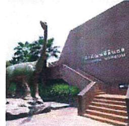
พิพิธภัณฑ์