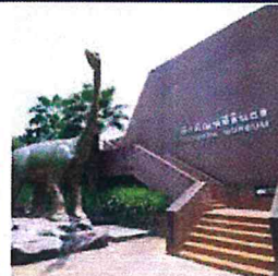
พิพิธภัณฑ์