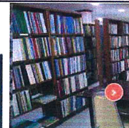
บริการห้องสมุด