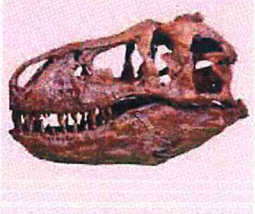
ซากดึกดำบรรพ์