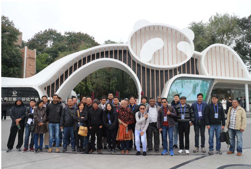
รูปที่ 8 คณะผู้เข้าร่วมสัมมนาพร้อมถ่ายภาพเป็นที่ระลึกบริเวณหน้าศูนย์วิจัยฯ