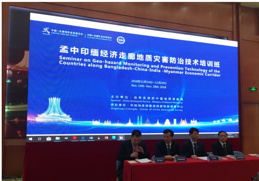
รูปที่ 3 พิธีเปิดการสัมมนา