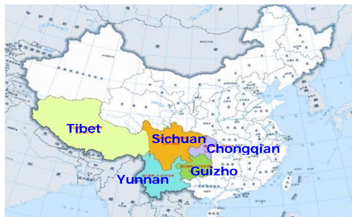
รูปที่ 13 เขตรับผิดชอบของ the Southwest Earth Science Innovation Center