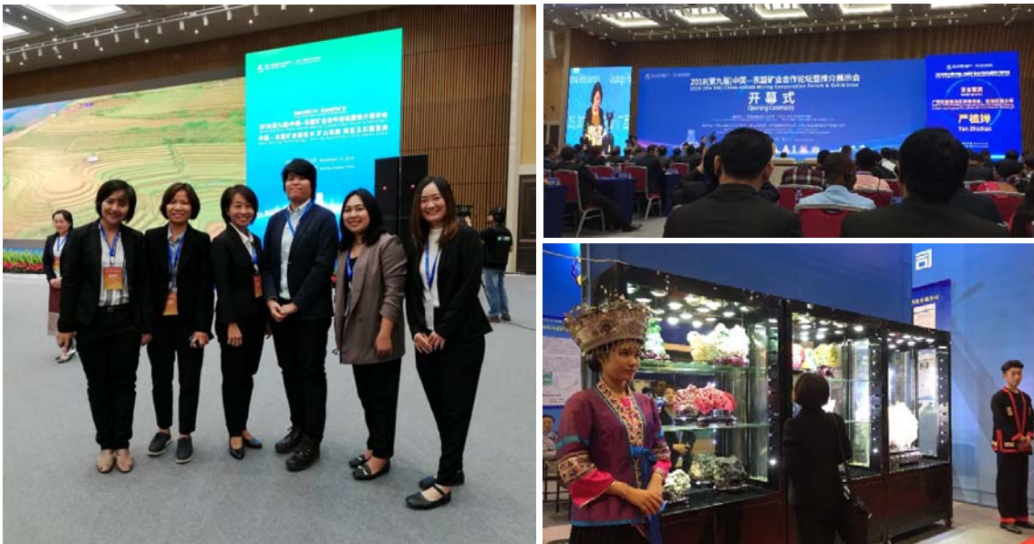
รูปที่ 2 คณะผู้แทนจากกรมทรัพยากรธรณี และกิจกรรมต่างๆ ในงาน

ในการไปสัมมนาครั้งนี้ คณะเจ้าหน้าที่จาก ทธ. ได้มีโอกาสเข้าร่วมการประชุม The 2018 (the 9 th ) China-ASEAN Mining Cooperation Forum & Exhibition ซึ่งจัดขึ้น ณ Nanning International Convention & Exhibition Centre เมือง Nanning มณฑล Guangxi ประเทศสาธารณรัฐประชาชนจีน ระหว่างวันที่ 15-16 พฤศจิกายน 2561 โดยความร่วมมือของรัฐบาลมณฑล Guangxi (Department of Natural Resources of Guangxi Zhuang Autonomous Region) กรมสำรวจธรณีวิทยาของสาธารณรัฐประชาชนจีน (China Geological Survey) หน่วยงานภาครัฐ และสมาคมต่างๆ ของจีนที่เกี่ยวข้อง วัตถุประสงค์ในการจัดประชุมคือ เพื่อนำเสนอสถานการณ์ปัจจุบัน ความคืบหน้าการดำเนินการและแผนการดำเนินการด้านธรณีวิทยาและการพัฒนาด้านเหมืองแร่ของสาธารณรัฐประชาชนจีนและกลุ่มประเทศอาเซียน โดยในการประชุมครั้งนี้ได้ให้ความสำคัญกับความร่วมมือระหว่างประเทศในแนวเส้นทางสายไหม (Silky Road Cooperation) และการพัฒนาอุตสาหกรรมเหมืองแร่สีเขียว (Developing Green Mining Industry) ทั้งนี้ในงานได้จัดให้มีกิจกรรมและการประชุมสัมมนาในหัวข้อต่างๆ มากมาย อาทิเช่น Mining Green Development Policy and Practice China-ASEAN Geoscience Cooperation และ China-ASEAN Mining Information Sharing Technology and Mechanism เป็นต้น