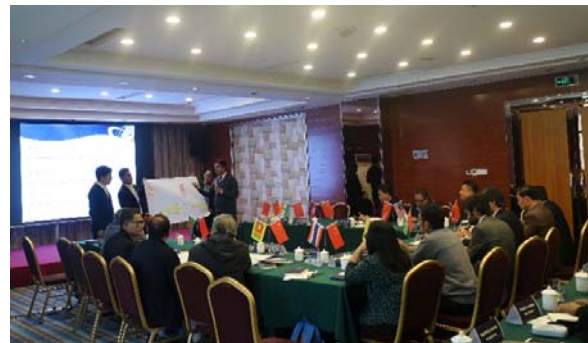
รูปที่ 5 การบรรยายและกิจกรรมในห้องสัมมนา