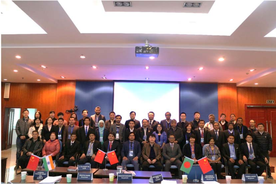
รูปที่ 14 คณะเข้าร่วมสัมมนา ณ กรมสำรวจธรณีวิทยาเมืองเฉิงตู (CC-CGS)