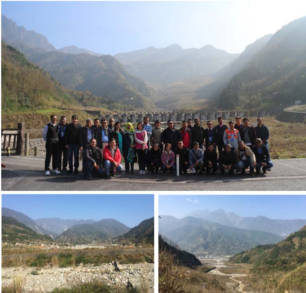
รูปที่ 12 Wenjia-Gully Debris flow

Weijia gully ตั้งอยู่ด้านเหนือของเมือง Qingping ในเขต Mianzhu County มณฑล Sichuan บริเวณแม่น้ำ Mianyuan ซึ่งไหลมาจากทางตอนเหนือของขอบที่ราบสูง Qing-Tibet plateau หลังจากเหตุการณ์แผ่นดินไหว เมื่อวันที่ 12 พฤษภาคม 2008 ได้เกิดเหตุการณ์ดินถล่มขนาดใหญ่ขึ้น โดยเกิดบนหินปูนที่ความสูง 1,885 – 2,340 เมตรจากระดับน้ำทะเลปานกลาง ตัวดินถล่มครอบคลุมพื้นที่มากกว่า 6.9 \times 10^5 ตร.ม. หนา 20 – 30 ม. ปริมาตรโดยประมาณ 2.75 \times 10^7 ลบ.ม. หลังจากดินถล่ม ตัวมวลดินถล่มไหลลงไปตามลำน้ำด้วยความเร็วสูง 93-122 ม./วินาที และก่อตัวเป็น Rock avalanche และทับบ้านเรือนกว่า 48 หลัง