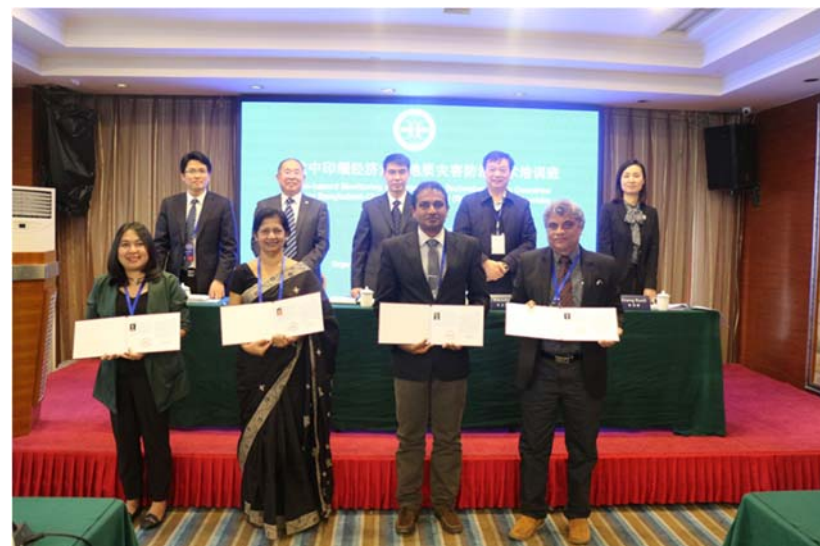
รูปที่ 6 พิธีปิดและมอบใบประกาศนียบัตร