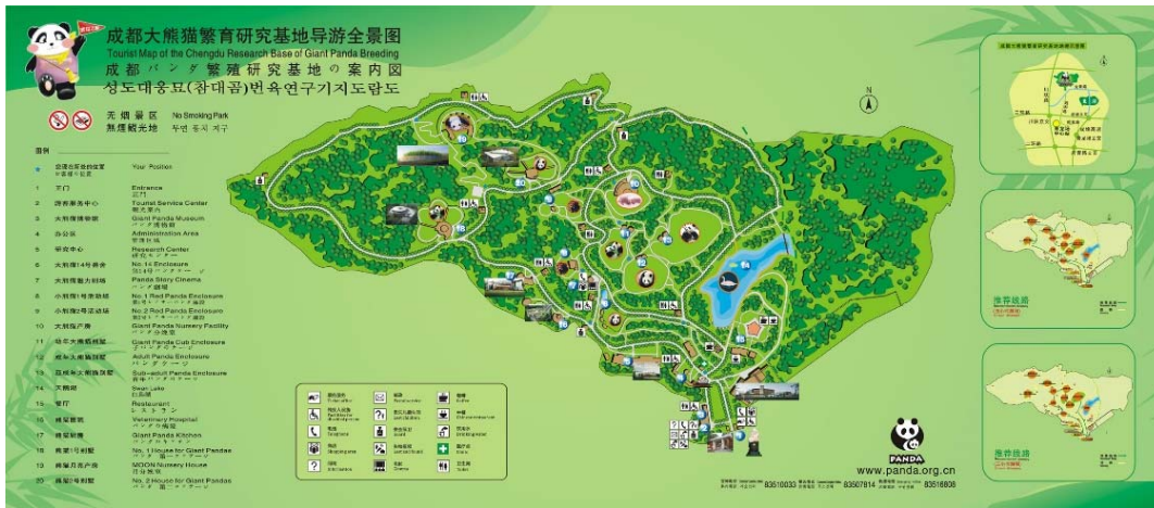
รูปที่ 7 แผนที่พื้นที่ Chengdu Research Base of Giant Panda Breeding

โดยศูนย์วิจัยฯ นี้ เปิดทำการตั้งแต่เวลา 07:30 น. - 18:00 น.