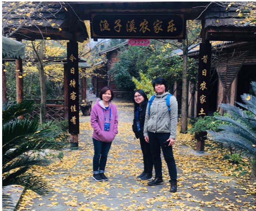
รูปที่ 1 คณะเจ้าหน้าที่จากกรมทรัพยากรธรณี ประเทศไทย