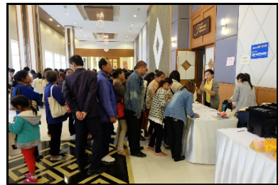
ภาพกิจกรรมการฝึกอบรมเชิงปฏิบัติการโครงการให้ความรู้เกี่ยวกับพระราชบัญญัติคุ้มครองซากดึกดำบรรพ์ พ.ศ. 2551 ครั้งที่ 14 จังหวัดอุบลราชธานี มีผู้เข้าร่วมอบรมจำนวน 135 ราย