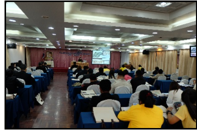
ภาพกิจกรรมการฝึกอบรมเชิงปฏิบัติการโครงการให้ความรู้เกี่ยวกับพระราชบัญญัติคุ้มครองซากดึกดำบรรพ์ พ.ศ. 2551 ครั้งที่ 13 จังหวัดลพบุรี มีผู้เข้าร่วมอบรมจำนวน 135 ราย