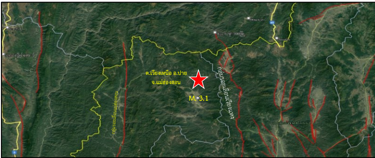
แผนที่แสดงตำแหน่งจุดเหนือศูนย์เกิดแผ่นดินไหวขนาด 3.1 บริเวณตำบลเวียงเหนือ อำเภอปาย จังหวัดแม่ฮ่องสอน

เหตุการณ์แผ่นดินไหวครั้งนี้ สาเหตุเกิดจากการเคลื่อนตัวของกลุ่มรอยเลื่อนเวียงแหง ที่มีการวางตัวในทิศเหนือ-ใต้ มีการเลื่อนตัวแบบรอยเลื่อนปกติ (Normal fault)