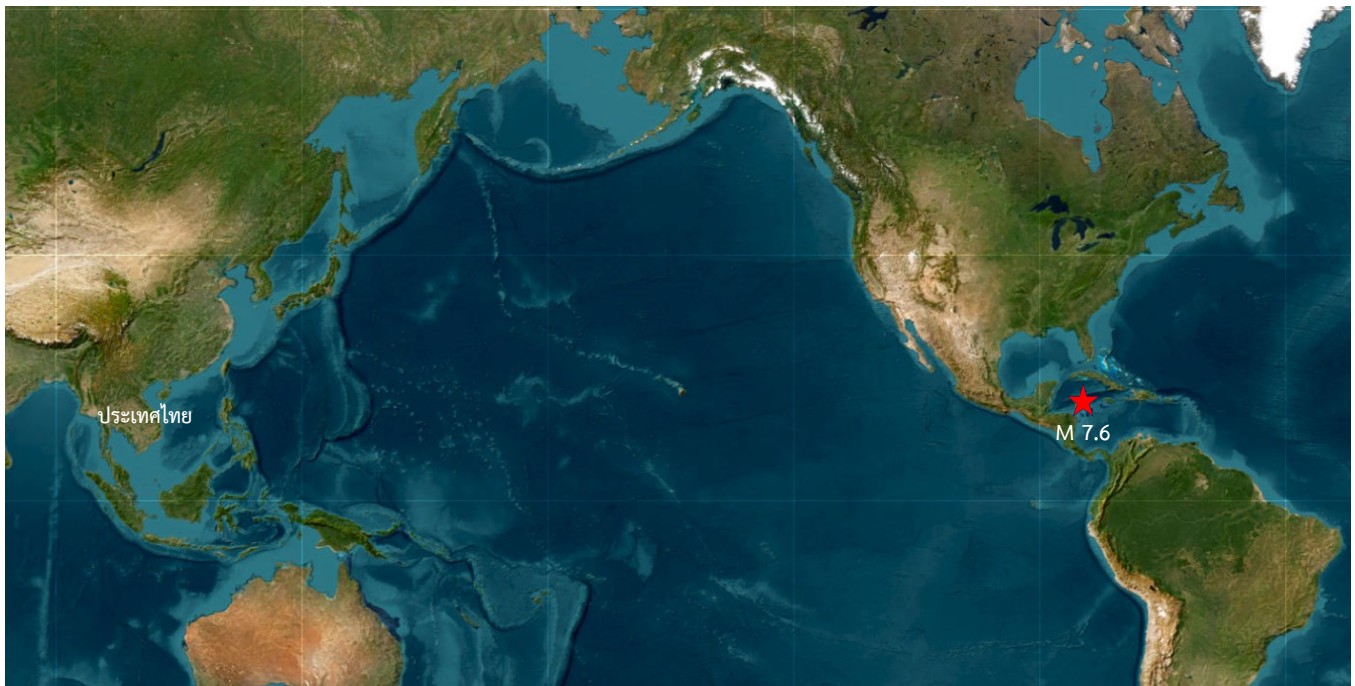
แผนที่แสดงจุดเหนือศูนย์กลางเกิดแผ่นดินไหวในทะเลแคริบเบียน ทางเหนือของฮอนดูรัสห่างจากเมืองหลวงจอร์จทาวน์

วันที่ 9 กุมภาพันธ์ 2568 เวลา 06.23 น. (ตามเวลาในประเทศไทย) เกิดแผ่นดินไหวในทะเลขนาด 7.6 จัดเป็นแผ่นดินไหวขนาดใหญ่ (Major) จุดเหนือศูนย์กลางเกิดแผ่นดินไหวในทะเลแคริบเบียน ทางเหนือของฮอนดูรัสห่างจากเมืองหลวงจอร์จทาวน์ไปทางทิศตะวันตกเฉียงใต้ค่อนข้างได้เป็นระยะทาง 209 กิโลเมตร ที่ระดับความลึก 10 กิโลเมตร เบื้องต้นมีประกาศแจ้งเตือนสึนามิ (ที่มา : USGS, www.tsunami.gov และกรมทรัพยากรธรณี)