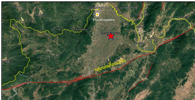
แผนที่แสดงตำแหน่งเกิดแผ่นดินไหว บริเวณตำบลบ้านด้าย อำเภอแม่สาย จังหวัดเชียงราย

เหตุการณ์แผ่นดินไหวครั้งนี้ สาเหตุเกิดจากการเลื่อนตัวของกลุ่มรอยเลื่อนแม่จัน ที่มีแนวการวางตัวในทิศเกือบทิศตะวันตก-ตะวันออก มีการเลื่อนตัวตามแนวระนาบเหลื่อมซ้าย (Left lateral strike slip fault) จัดเป็นแผ่นดินไหวขนาดเล็ก (Minor) โดยการรับรู้ความรุนแรงของแผ่นดินไหวตามมาตราเมอร์คัลลี อยู่ในระดับ 2-3 (เบามาก) คนที่อยู่กับที่จจะรู้สึกวาพื้นสั่น (ที่มา : กรมทรัพยากรธรณี)